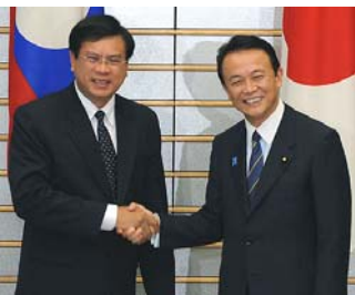
ພະນະທ່ານນາຍົກລັດຖະມົນຕີ ບົວສອນ ບຸບຜາວັນ ໄດ້ພົບປະສອງຝ່າຍກັບພະນະທ່ານ ອາໂຊ ຕາໂຣ ນາຍົກລັດຖະມົນຕີຍີ່ປຸ່ນ , ທີ່ໂຕກຽວ 20/05/2009

ການຮ່ວມມືແລກປ່ຽນນີ້ເກີດຂຶ້ນມາໄດ້ ກໍ່ຍ້ອນວ່າ ຍີ່ປຸ່ນແມ່ນໃຫ້ຄວາມສຳຄັນ ຕໍ່ພາກພື້ນແມ່ນ້ຳຂອງ ຢູ່ສະເໝີ ແລະ ກໍ່ຍັງສືບຕໍ່ມີບົດບາດຫຼາຍໆດ້ານ ໃນພາກພື້ນນີ້. ຍີ່ປຸ່ນໄດ້ສືບຕໍ່ພະຍາຍາມ ໃນການ ພັດທະນາເຊື່ອມໂຍງຕໍ່ “ພາກພື້ນແມ່ນ້ຳຂອງ - ພາກພື້ນແຫ່ງຄວາມຫວັງ ແລະ ການພັດທະນາ” ໂດຍການສົ່ງເສີມການຄ້າ ແລະ ການລົງທຶນ ແລະ ກິດຈະກຳອື່ນໆ ທີ່ເຊື່ອມໂຍງກັບພາກລັດ ແລະ ເອກະຊົນ. ເຊິ່ງດັ່ງກ່າວ ໄດ້ເຮັດໃຫ້ປະ ເທດມະຫາອຳນາດອື່ນໆ ໃນຂົງເຂດອາຊີນີ້ບໍ່ວ່າ ຈະເປັນຈີນ, ເກົາຫຼີໃຕ້, ອິນເດຍ ກໍ່ຢາກມີບົດ ບາດໃນພາກພື້ນນີ້ເຊັ່ນດຽວກັນ.