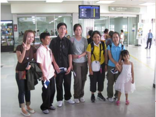
ບິນີ້ໃຜຢາກໄປແດ່ ຊິມີຂຶ້ນ! ບກ ກໍ່ຢາກໄປຢູ່ໃດ່ ແຕ່ ອາຍຸ?

ການຂາຍເຄື່ອງໃນງານມະຫາກຳຮູບເງົາກາຕູນຍີ່ປຸ່ນ 2008 ຢູ່ເດີນທຳວັດທະນາທຳ