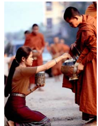
ຄວາມງົດງາມທີ່ເປັນເອກະລັກຂອງຜູ້ຍິງລາວ ຢ່າງນຶ່ງກໍຄືການນຸ່ງສິ້ນ! ບກ