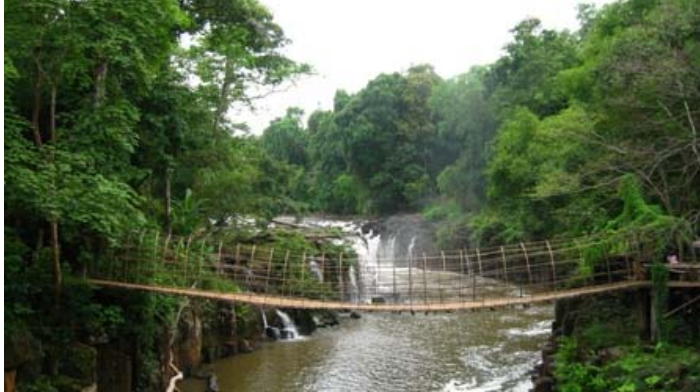
ລາງວັນທີ3 ຂອງການປະກວດປີ2009 ພາຍໃຕ້ຫົວຂໍ້ “ສິ່ງແວດລ້ອມລາວ”

ຈະເກັບພາບທີ່ທ່ານປະທັບໃຈໄວ້, ເພື່ອສົ່ງເຂົ້າມາຮ່ວມປະກວດ. ການຄັດ ເລືອກແມ່ນມາຈາກການໂທວດຂອງທຸກໆຄົນທີ່ມາຍ້ຽມຢາມ JICafe, ດັ່ງ ນັ້ນຈິ່ງຢາກຂໍເຊີນທຸກໆທ່ານ ມາຍ້ຽມຊົມ ແລະຊ່ວຍກັນໃຫ້ຄະແນນຮູບພາບ ທີ່ມາຈາກທຸກຂົງເຂດໃນປະເທດລາວ ທີ່ຈະຖືກວາງສະແດງຢູ່ທີ່ JICafe, ເຊິ່ງຈະມີຂຶ້ນຫຼັງຈາກຮັບຮູບພາບຄືປະມານ ເດືອນ10 ຫາເດືອນ11. ຈະ ເປັນຫົວຂໍ້ໃດນັ້ນ ທ່ານສາມາດຕິດຕາມການປະກວດໄດ້ຈາກ poster, ໜັງ ສືພິມ ຫຼືສອບຖາມໄດ້ໂດຍກົງນຳ JICafe.