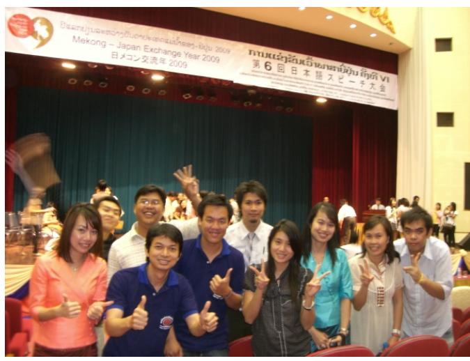
ການແຂ່ງຂັນເວົ້າພາສາຍີ່ປຸ່ນ 2009 ບິດີ່ໄປ ໃຜຢາກເປັນພິທີກອນ? ບກ ກໍ່ຢາກເປັນຢູ່ໃດ່!

ບັນຍາ ແລະ ຈີນ ກຳລັງແຂ່ງກັນຮ້ອງເພັງ. ຜູ້ອື່ນກໍ່ຢາກຮ້ອງຄືກັນໄດ້! ບກ